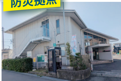
廃止予定の町方コミュニティセンター

愛西市は市民のくらしに不可欠な、17の公共施設を廃止しようとしています。市内11のコミュニティセンターのうち10を廃止するという驚くべき計画です。