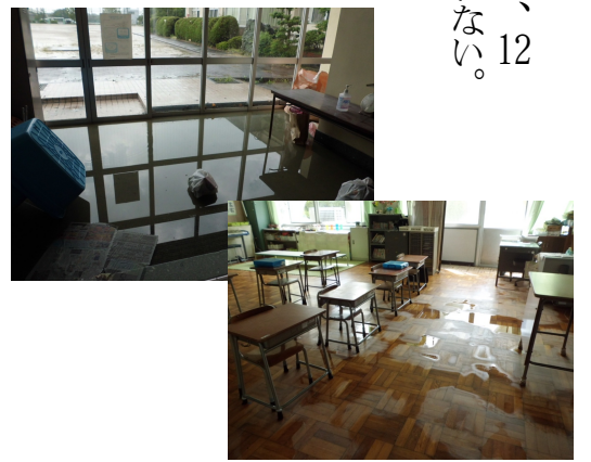
1階が浸水した佐屋小学校