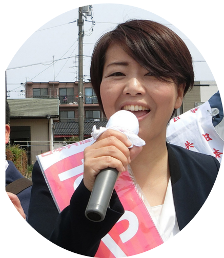
日本共産党参院愛知選挙区予定候補